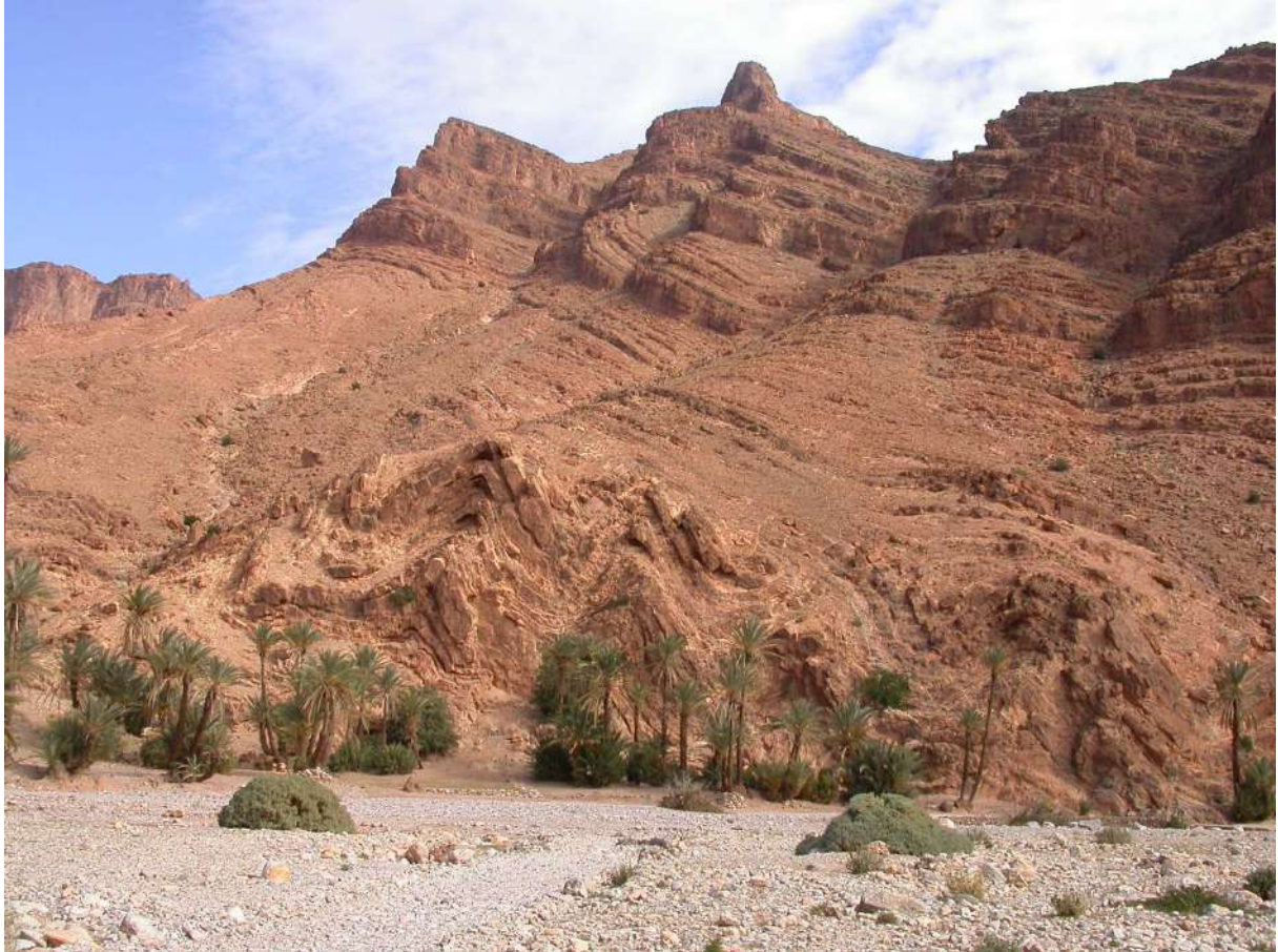
Plissement disharmonique des calcaires du Cambrien de l'Anti-Atlas, région d'Igherm.

Ce domaine est situé géographiquement au sud de la chaîne du Haut Atlas. D'un point de vue géologique il fait partie du craton ouest africain et ses marges.